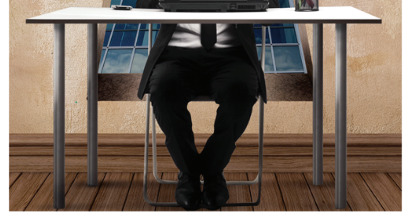
www.ehfc.com.eg | 19432